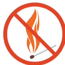
ВЫЖИГАНИЕ СУХОЙ ТРАВЯНИСТОЙ РАСТИТЕЛЬНОСТИ