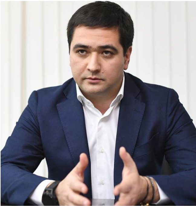
Глава Федеральной кадастровой палаты Парвиз Тухтасунов

Ф едеральная кадастровая палата официально запустила сервис по выдаче сведений из Единого государственного реестра недвижимости (ЕГРН). Сейчас в соответствии с законодательством выдавать сведения об объектах недвижимости ведомство должно в течение трех суток. Сервис позволил сократить время выдачи сведений до нескольких минут.